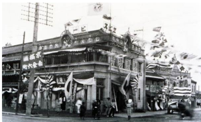
日本初のビヤホール「恵比壽ビヤホール」

当時は、蕎麦（もり・かけ）1銭8厘、コーヒー2銭、日本酒（上等酒）1升25銭3厘で販売される中、ビール500mlは10銭とまだまだ高級な時代でしたが、恵比壽ビヤホールは非常に繁盛し、何時でも満員御礼、毎日売切れの立札をするほどで、1日の来客数は平均800人に達しました。遠方から馬車でやってくる人もいたそうです。