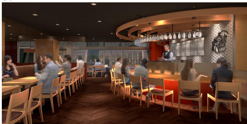
店内イメージパース

「JOY OF LIVING－生きている喜びの提供－」を企業理念に、ビヤホール・レストランなどを運営している株式会社サッポロライオン（本社・東京都渋谷区、社長・三宅祐一郎）は、南海本線 難波駅すぐにある商業施設「なんば CITY」の南館 1F に 2019 年 11 月 7 日（木）「YEBISU BAR The Grill なんば CITY 店」をオープンします。