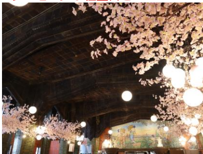
お花見ビヤホール

ビヤホールライオン 銀座七丁目店にて4月17日（日）までの期間限定で店内を大々的に桜の装飾をした「 お花見ビヤホール 」を実施中です。創建88周年を迎える現存する日本最古のビヤホールで、日本らしいお花見が楽しめる期間限定のイベントです。