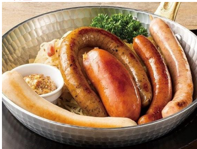
ソーセージ5種盛合せ

また、4月7日までは、 サッポロ生ビール黒ラベル特大ジョッキ を謝恩価格 888 円（税込 976 円） 、創建日後の4月9日（土）・10日（日）では、 ソーセージ5種盛合せ を謝恩価格 1,888 円（税込 2,076 円） にて提供します。