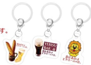
「めじるしマーカークー」イメージ

※ブランド・店舗によって、対象となる生ビールの種類・サイズ、景品の種類が異なります。 ※当たり券は、必ず抽選店舗で当日中に特典と引き換えをお願いします。 ※はずれがあります。 ※予定配布数量に達した店舗より順次終了いたします。