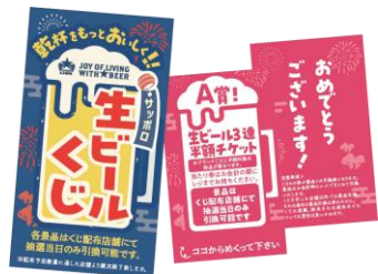
スピードくじイメージ

対象となる生ビールを1杯ご注文につき、素敵な景品が当たるスピードくじを1枚プレゼントいたします。