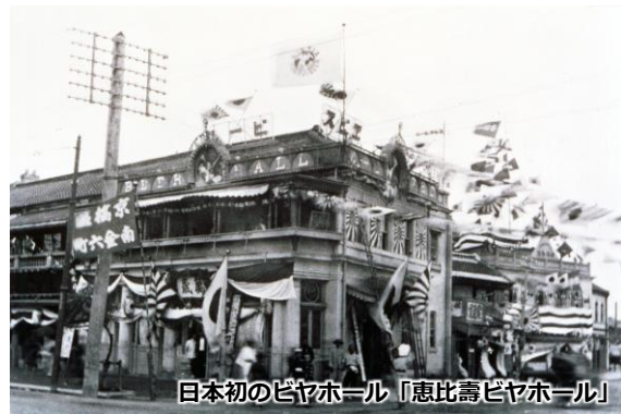
日本初のビヤホール「恵比壽ビヤホール」

当時は、蕎麦（もり・かけ）1銭8厘、コーヒー2銭、日本酒（上酒）1升25銭2厘で販売される中、ビール500mlは10銭とまだまだ高級な時代でしたが、恵比壽ビヤホールは非常に繁盛し、何時でも満員御礼、毎日売切れの立札をするほどで、1日の来客数は平均800人に達しました。遠方から馬車で訪れる人もいたそうです。