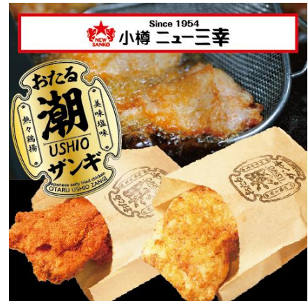
小樽の手作り海水塩を使った 大サイズのザンギ！ ★おたる潮ザンギ 1 個 650 円 HOTスパイス 1 個 700 円

参加型「サッポロ SORACHI 1984×北海道おつまみ ペアリンググランプリ」開催！