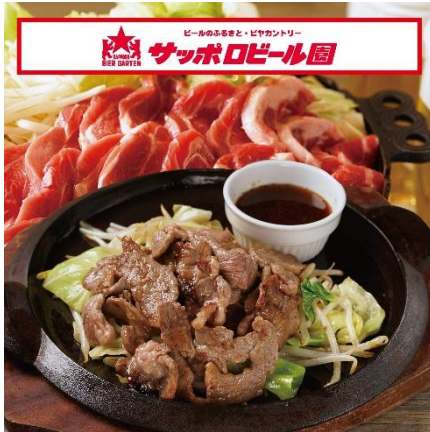
サッポロビール園のタレで楽しむ ★サッポロビール園 ジンギスカン 1,950 円

今年も開催！作りたてをご提供！ライブキッチンフードメニュー 北海道のご当地グルメがたくさん！