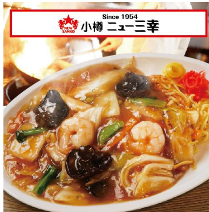
小樽老舗レストランの味！ ★小樽名物 あんかけ焼そば 1,450 円