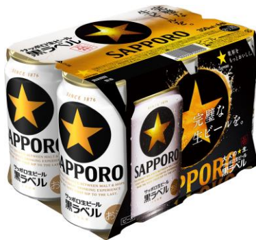
景品① 黒ラベル6缶パック