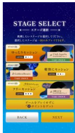
ステージ選択 画面イメージ