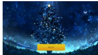
クリスマスストーリー 画面イメージ