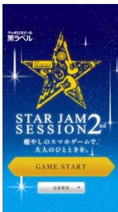
トップ 画面イメージ