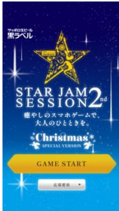
トップ 画面イメージ