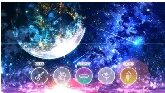
軽快にセッションステージ プレイ画面イメージ