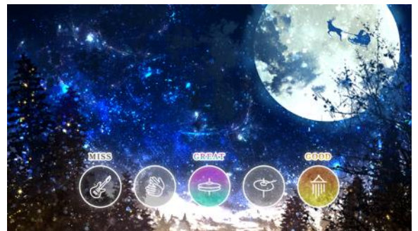
プレイ画面イメージ (3ステージ共通)