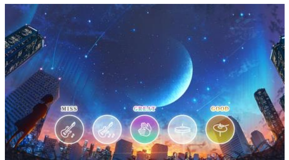
ゆったりセッションステージ プレイ画面イメージ