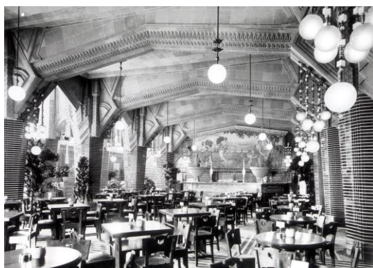
開店当時のビヤホールライオン 銀座七丁目店

公式ホームページ： https://www.ginzalion.jp/shop/brand/lion/shop1.html