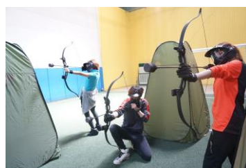
アーチェリーハント

海外で話題の新感覚アクティビティ。どなたでもお楽しみいただける弓矢を使ったサバイバルゲームです。注目のアクティビティをぜひご体験ください ※中学生以上対象