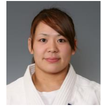
谷本歩実 アテネ・北京オリンピック 柔道金メダリスト