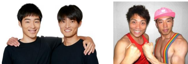
ジャルジャル 10月7日(土)出演