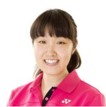
廣瀬栄理子 北京オリンピック バドミントンシングルス ベスト16