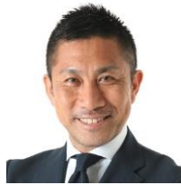
前園真聖 アトランタオリンピック サッカー日本代表