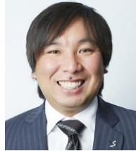
里崎智也 元プロ野球選手