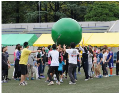
大人が楽しむ運動会