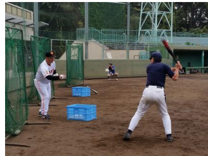
大人のための野球教室（18歳以上）

よしもと芸人のみなさんと参加者が各チームに分かれて、優勝を目指して競技に挑みます。※18歳以上対象