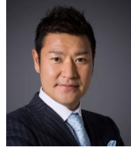
高橋尚成 元プロ野球選手