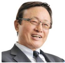
釜本邦茂 メキシコシティオリンピック サッカー銅メダリスト