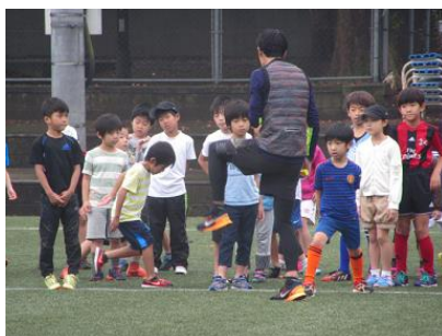
かけっこ教室（対象：小学生または小学生＆親子）