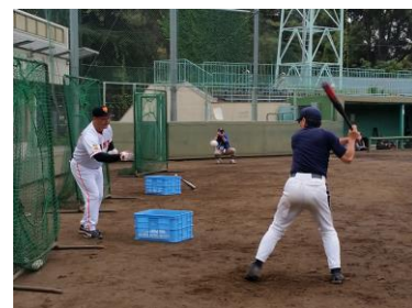
大人のための野球教室