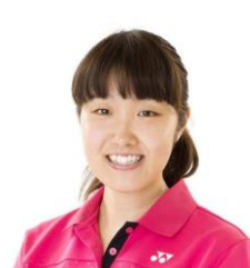
廣瀬米理子 北京オリンピック バドミントンシングルス ベスト 16