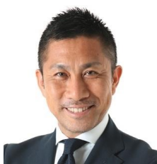
前園真聖 アトランタオリンピック サッカー日本代表