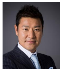
高橋尚成 元プロ野球選手