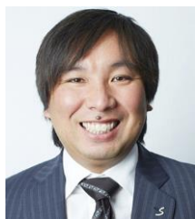
里崎智也 元プロ野球選手 2006 ワールド・ベースボール・ クラシック日本代表 優勝