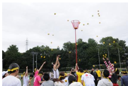
大人が楽しむ運動会