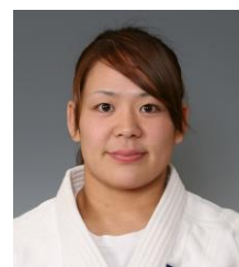
谷本歩実 アテネ・北京オリンピック 柔道金メダリスト