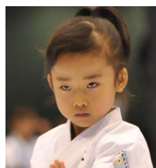
高野万優 2020 KARATE アンバサダー