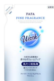
ファーファ ファインフレグランス ウォッシュ詰替