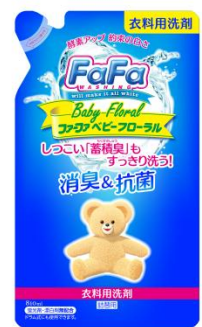
ファーフア液体洗剤 ベビーフローラル