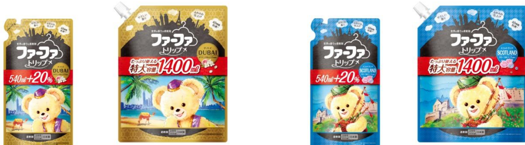
ファーファトリップ ドバイ

当社は今後も消費者視点の商品開発を行っていくことで、より多くの家族がお洗たくを通じて「家族と過ごす時間」を充実したものにできるよう、新たなライフスタイルを提案していきます。