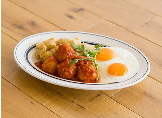
ミートボール&エッグス 価格:1,100 円(税別)