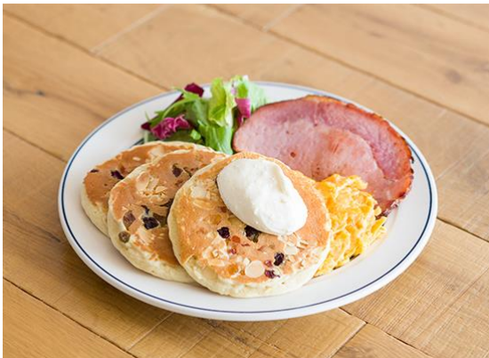
ドライフルーツとナッツのパンケーキプレート 価格:1,000 円(税別)