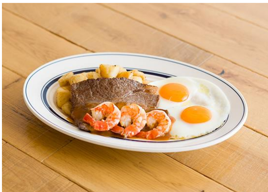
サーフ&ターフ、&エッグス 価格:1,680円(税別)