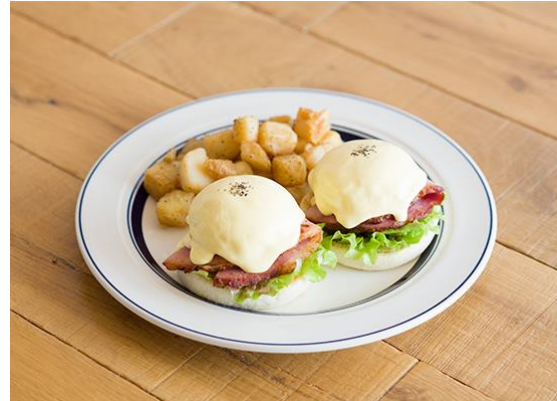
ハニーベイクド・ハム® 価格:1,450 円(税別)