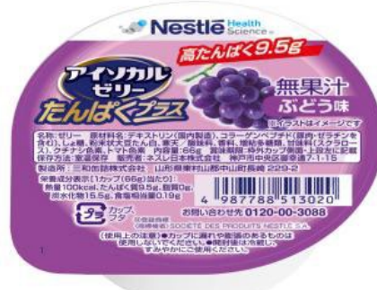
左から:パイナップル味、ぶどう味