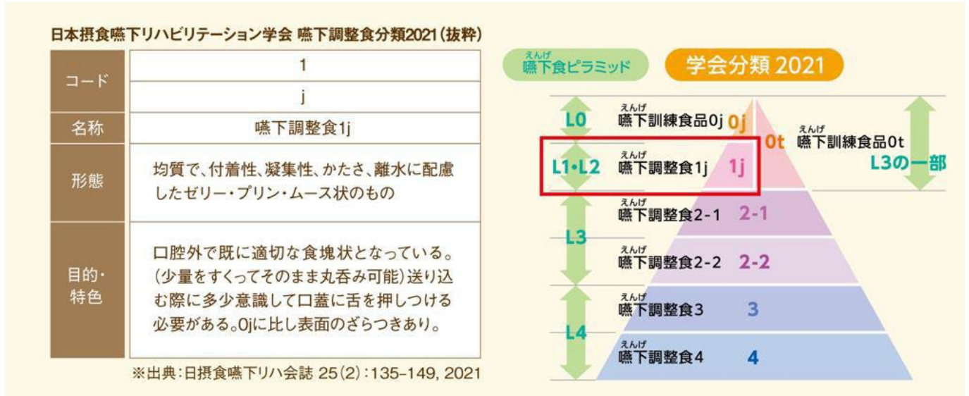
日本摂食嚥下リハビリテーション学会 嚥下調整食分類 2021(抜粋)

日本摂食嚥下リハビリテーション学会 嚥下調整食分類 2021(学会分類 2021)のコード 1j 相当に調整し、物性のバランスを追求しました。