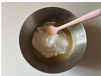
④米粉、ベーキングパウダーを加えて切るように軽く混ぜる。