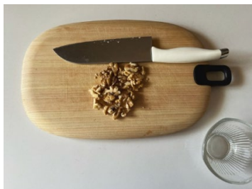
①くるみは荒めに刻む。