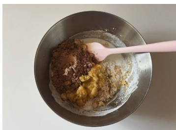
⑤「Orgain(オルゲイン)オーガニックプロテインチョコレートファッジ風味」、バナナを加えて混ぜ合わせる。