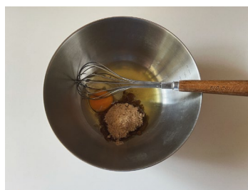
③ボウルに卵、米油、きび糖を加えて混ぜ合わせる。