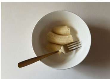
②バナナをフォークで潰す。