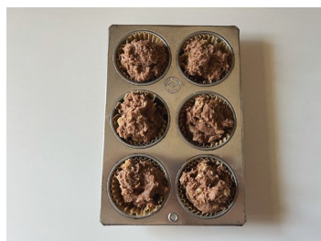
⑥型に生地を流し入れる。