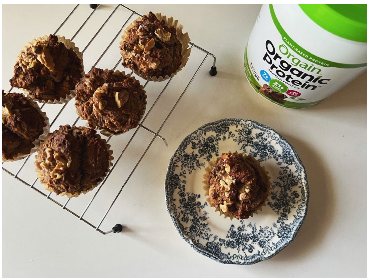
「Orgain(オルゲイン)」入りバナナの米粉マフィン

ネスレ ヘルスサイエンスは、より多くの方々に健康的で美味しいオーガニックプロテイン「Orgain(オルゲイン)」を楽しんでいただけるよう、さまざまな取り組みを展開してまいります。