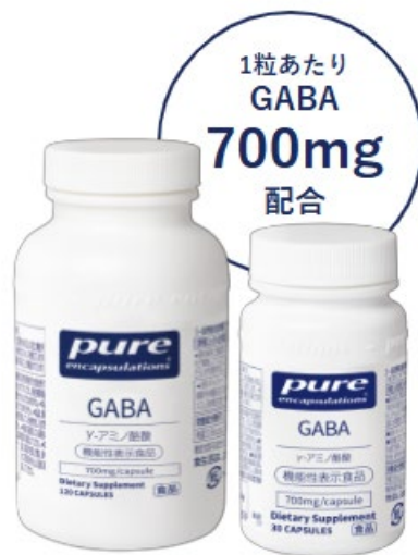
Pure Encapsulations GABA 120 粒