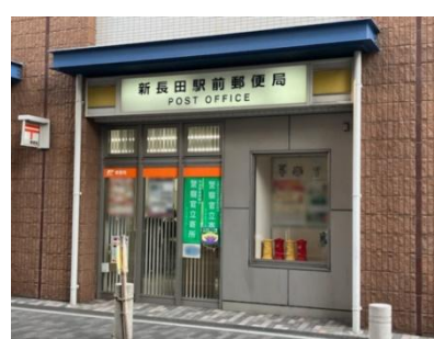
啓発の様子(新長田駅前局)