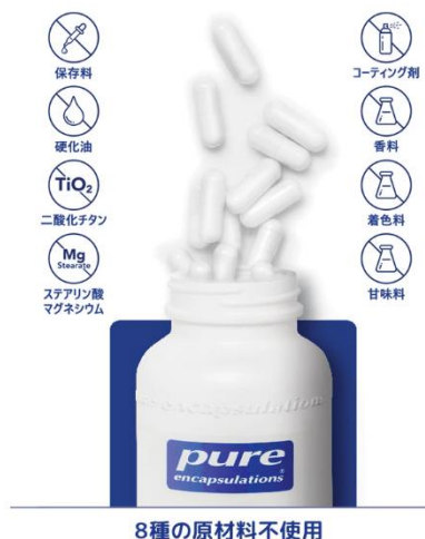
8種の原材料不使用