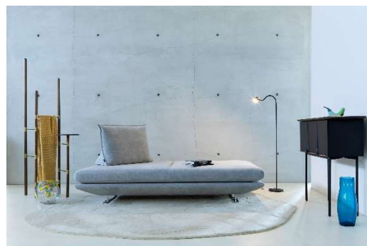
ロゼプラド発売 10 周年記念アニバーサリーモデル