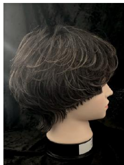
角 百心様 高津理容美容 専門学校