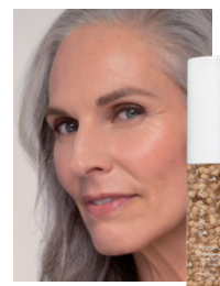
3 ミディアムライト