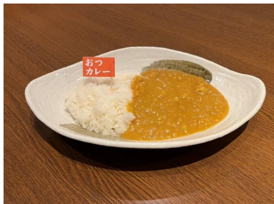
受験生を労う甘口の『おつかカレー』

受験という人生の大きな挑戦を前に、「気合を入れて頑張りたい！」という受験生にエールを送るため受験生応援企画として「応援カレー」を実施します。対象となるのは、小学校から大学までの入学試験に挑戦する受験生で、受験前に『うカレー』、受験後に『おつかカレー』の2種類のカレー（ご飯150g）を無料で提供します。カレーを食べるとスパイスの働きで脳の血流がUPし、集中力や計算力が高まると言われていて、受験生に「カレーを！」と企画しました。