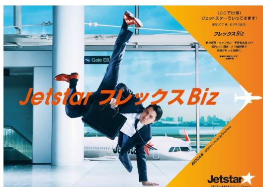
「フレックス Biz」キービジュアル①

なお、「フレックス Biz」のコミュニケーションビジュアルには、「フレックス Biz」の最大の特徴である「柔軟性」をジェットスター流に表現するために、ブレイクダンサーを起用しています。