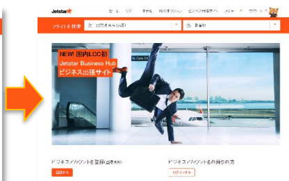
「フレックス Biz」紹介ページ