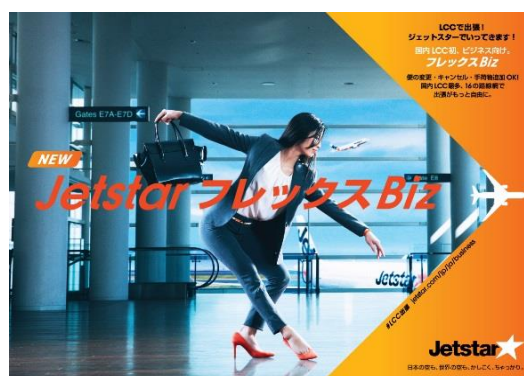
「フレックス Biz」キービジュアル②