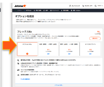
オプション選択画面