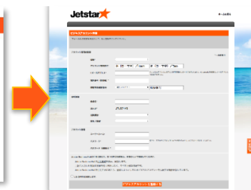
アカウント登録画面