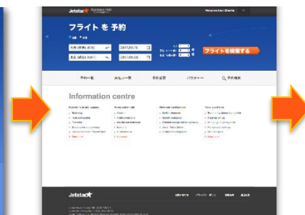
「Jetstar Business Hub」ホーム画面