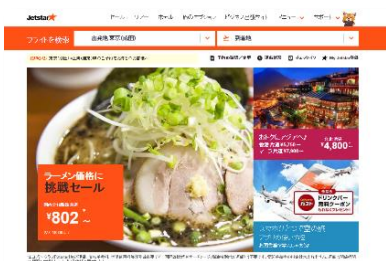
ジェットスター公式サイト