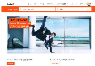
「フレックス Biz」紹介ページ