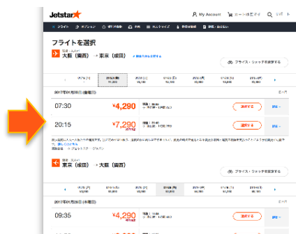
フライト選択画面