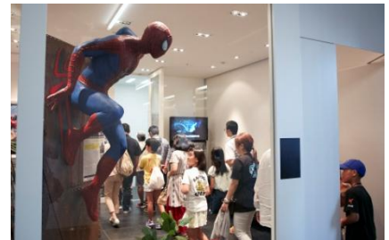
映画の迫力と主人公に夢中なよう

成田空港から都内のソニー・ピクチャーズ エンタテインメント本社へ移動し、8 月 11 日(祝・金)の日本公開前の映画『スパイダーマン：ホームカミング』を鑑賞。公開前ということもあり、親子たちはワクワクドキドキしながら、マスコミと関係者しか基本的に入場できない試写室へ。待ちに待った映画が始まり、先ほどまで一緒にいた公式スパイダーマンがスクリーンに再び登場すると、あっという表情で興奮している子どもも。席を一度も立つことなく、親子たちは真剣にスクリーンを見つめながら、時折声を出しながら笑ったり、驚いたり、映画に釘付けになっているようでした。映画を見た子どもからは、「すごい迫力だった！スパイダーマンもかっこよかった」と、