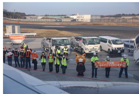
(スタッフによるお見送りの様子)

離陸後シートベルトサインが消えると、機内後方にてお母さまにベールダウンをされた新婦は、新郎の待つ機内前方へバージンロードに見立てた通路をゆっくりと向かわれました。そして二人は、ご両親とキャビンクルーに見守られ、牧師の前で指輪を交換、誓いのキスをかわし、永遠の愛を誓いました。そこから、二人の似顔絵が描かれた新婦手作りのウエディングケーキを赤い糸でカットしての微笑ましいファーストバイト、新婦からお母さまへの感謝の言葉が続き、機内は温かくも感動的な空気に包まれました。最後に、「空の上での結婚式という前例のないことができたのも、ひとえに皆様のおかげと心より感謝を申し上げます。昨今のコロナ禍の中、結婚式を開催するイメージが付かなかったところ、このような素晴らしい式を催させて頂き、本当にありがとうございました。お父さんお母さんからもらった愛と同じように、私たちもたくさんの愛を育てていきたいと思えます。」という新郎からの挨拶で結婚式は締めくくられました。