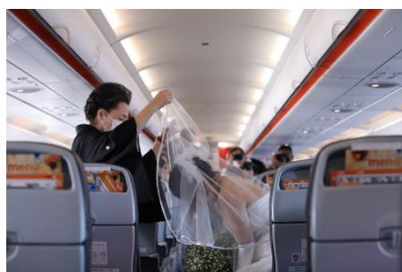
(ベールダウンをする新婦とお母さまの様子)

離陸後シートベルトサインが消えると、機内後方にてお母さまにベールダウンをされた新婦は、新郎の待つ機内前方へバージンロードに見立てた通路をゆっくりと向かわれました。そして二人は、ご両親とキャビンクルーに見守られ、牧師の前で指輪を交換、誓いのキスをかわし、永遠の愛を誓いました。そこから、二人の似顔絵が描かれた新婦手作りのウエディングケーキを赤い糸でカットしての微笑ましいファーストバイト、新婦からお母さまへの感謝の言葉が続き、機内は温かくも感動的な空気に包まれました。最後に、「空の上での結婚式という前例のないことができたのも、ひとえに皆様のおかげと心より感謝を申し上げます。昨今のコロナ禍の中、結婚式を開催するイメージが付かなかったところ、このような素晴らしい式を催させて頂き、本当にありがとうございました。お父さんお母さんからもらった愛と同じように、私たちもたくさんの愛を育てていきたいと思えます。」という新郎からの挨拶で結婚式は締めくくられました。