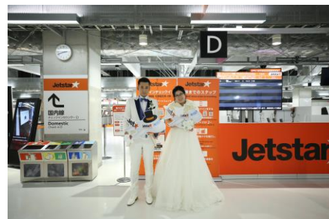
(チェックインカウンター前の記念撮影の様子)