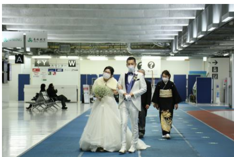
(第3ターミナルに登場された二人)

空港では、チェックインカウンター前やゲートなど、搭乗までの様々なところで記念撮影を実施。飛行機をバックにした撮影には、航空ファンの二人も興奮を隠せない様子でした。そのほかにもジェットスターの公式キャラクター、ジェット太とスタッフによるお見送りやコンテナを使ったサプライズメッセージの演出など、多くのジェットスタースタッフが二人をお祝いました。