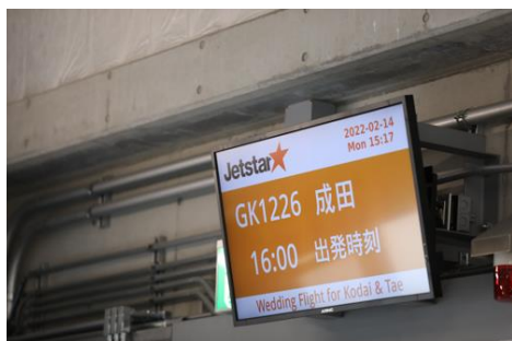
(チャーター便の案内表示)

二人の交際開始日である 12 月 26 日にちなみ、便名は GK1226。ジェットスターのキャビンクルーに出迎えられ搭乗した二人は少し緊張した面持ちでしたが、司会から「二人の明るく輝かしい未来へ、テイクオフ！」と声がかかると、一様に顔をほころばせました。そして GK1226 便は和やかな雰囲気の中、二人とご両親、牧師を乗せてついに離陸。ジェットスター史上初の「空の上の結婚式」がスタートしました。