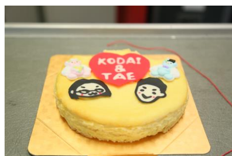
(二人の似顔絵が入った新婦手作りケーキ)