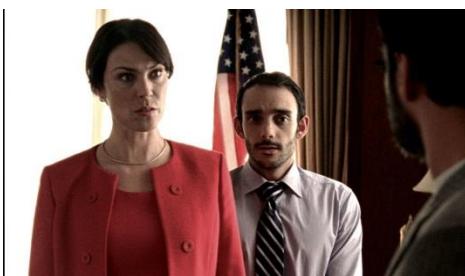
4月6日（月）公開 『世界平和会議』（アメリカ）

「世界のショートフィルム★名作セレクション」は、ひとつのテーマにつき制作国や舞台の異なる2作品をセレクトしてお届けすることで、作品ごとの「違い」を楽しめると同時に、“人生の素晴らしさ”といったどの作品にも共通する普遍性を味わえるラインナップとなっています。