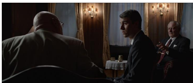
3月30日（月）公開 『ベルリン・トロイカ』（ドイツ）

http://m.nestle.jp/entertain/nestle_theater/ (スマートフォン/タブレット端末)