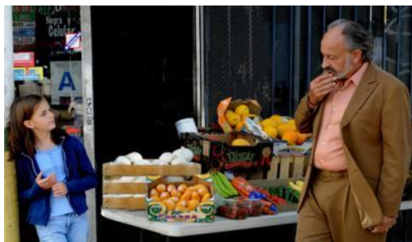
5 月 25 日（月）公開『おじいちゃん』