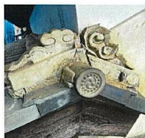
土蔵（熨斗止め）の修復