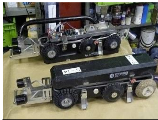
管内検査・作業ロボット