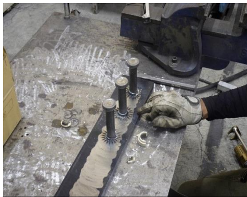
スタッド溶接後の様子