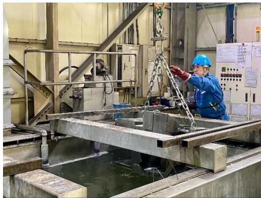
めっき作業の様子