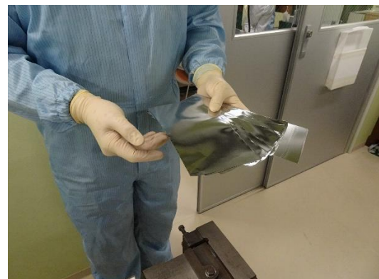
圧延加工後の金属箔