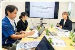
東京メーターでの取材風景