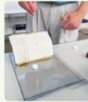
日本乳化剤でのデモンストラーション