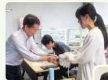
社長と名利交換も