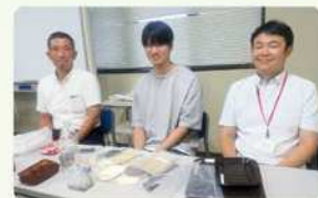
ヘムセルロースの取材にて