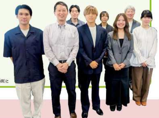
※川崎未来エネルギーの井田社長(左から2番目)と