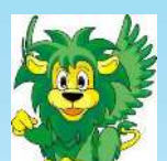
専修大学マスコット「センディー」