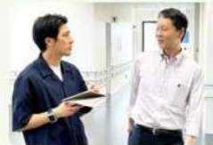
川崎未来エネルギーでの取材風景