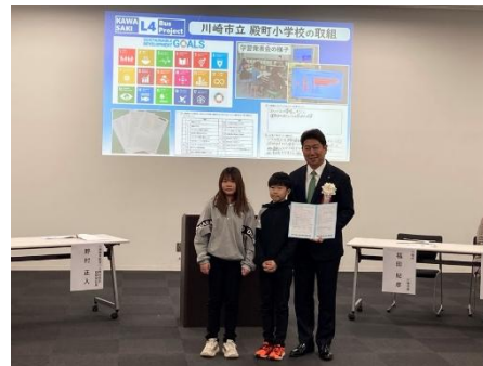
【殿町小学校の児童との記念写真】