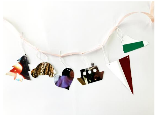
ガーランドのイメージ