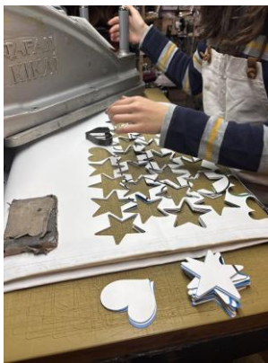
ターポリン生地を型抜き