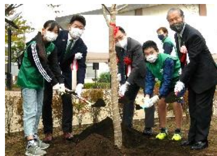
《植樹セレモニーイメージ》