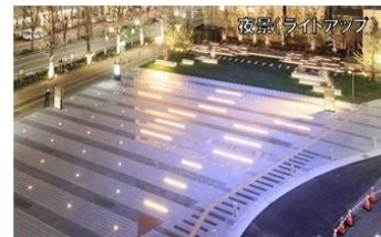
夜景 ライトアップ