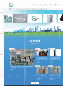
ホームページでの広報