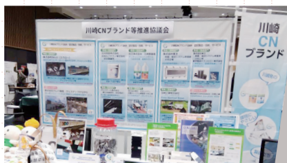
展示会への出展 (新川崎マッチング展)