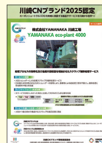
個別ポスター (2025認定YAMANAKA社)