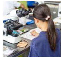
顕微鏡を使って ミクロの世界を観察