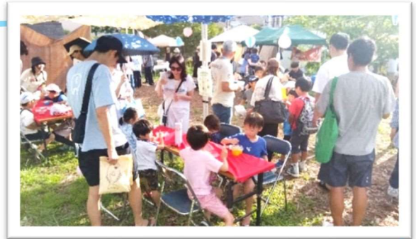
（令和7年7月開催時の様子）