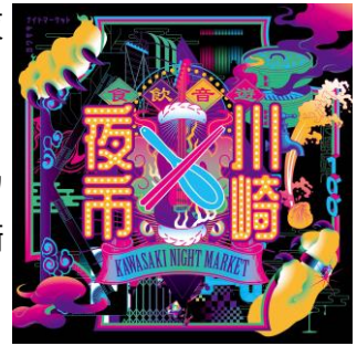
川崎夜市のキービジュアル

川崎市市制 100 周年という特別な年に開催される第 3 回「川崎夜市」では、過去同様に川崎で愛されるグルメが一堂に会し、皆さまをお迎えします。「川崎ソウルフード屋台」では、川崎各地の人気店や名物メニューが融合し、まるで川崎の街の多様性を体現するような体験が広がります。また、「川崎駅前バル祭り」では、個性豊かな飲食店を巡り歩く楽しみが待っています。雑多でディープな川崎の夜に、飛び込んでみませんか？今年、川崎市市制 100 周年を祝う特別な記念の夜市。多様な文化が織り成すエネルギーに包まれた、他では味わえない川崎の夜を、心ゆくまでお楽しみください。川崎の街があなたに贈る、特別な一夜がここにあります。