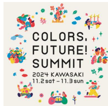
Colors,Future!Summit 2024 のロゴマーク