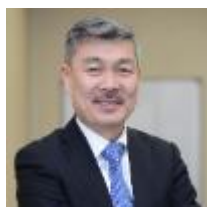
藤井聡 京都大学大学院工学研究科 (都市社会工学) 教授