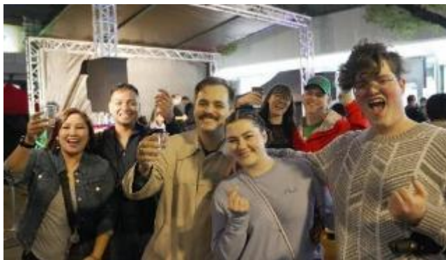
昨年の様子：多くの人でにぎわう川崎ソウルフード屋台