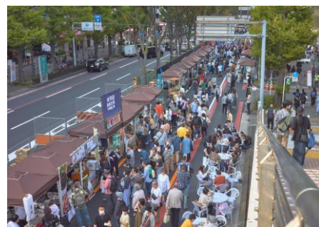
昨年開催したみんなの川崎祭の様子