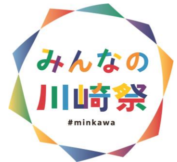
みんなの川崎祭のロゴマーク