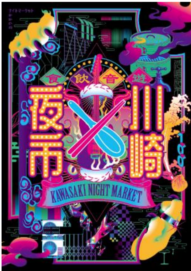
今年度のキービジュアル

(HPはこちら： https://lacittadella.co.jp/lp/kawasakiyoichi/ )