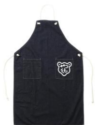
・木彫り熊マークデニムエプロン ¥8,250(税込)