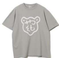
・木彫り熊マークTシャツ ¥5,500(税込)