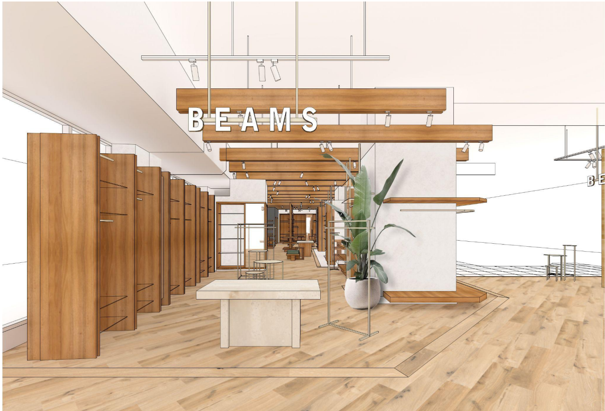
※「大手前通り」側の施設エントランスから見た「ビームス 姫路」の入り口

姫路の目抜き通りであり、世界遺産の「姫路城」へと続く「大手前通り」側の施設エントランスすぐに設けたイベントスペースでは、地元の魅力発信と連動した企画や、トレンドアイテムの紹介などを計画しており、オープン日の4月28日（金）から5月14日（日）までの期間は、日本の伝統技術を後世に残すためのビームスによるプロジェクト『Calling BEAMS CRAFTS IN THE MAKING（コーリング ビームス クラフツ イン ザ メーキング）』の取り組みとして、姫路周辺を主な産地とする成牛革（せいぎゅうひ）を使用した〈HYOGO LEATHER（ひょうごレザー）〉のポップアップショップを開催します。