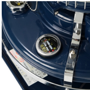
< 油量計 > タンク内の灯油量が一目でわかります。