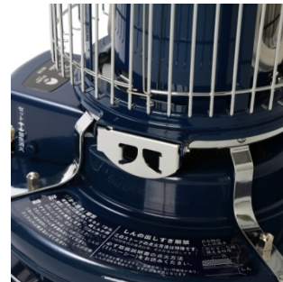
< 上枠クリップ > クリップを外し、本体上部を倒すと燃焼部があります。