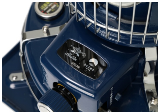
シリアルナンバー入りコラボ銘板