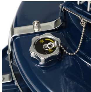
< 給油口 > 給油口のふたを開け灯油を給油します。