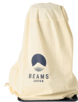
アラジン×BEAMS JAPANオリジナル収納カバー付 左：裏 右：表