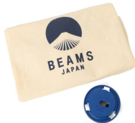
(上)アラジン×BEAMS JAPANオリジナル収納カバー (下)専用しんクリーナー