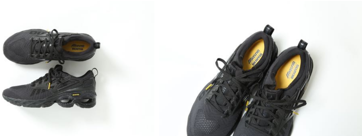
MIZUNO WAVE CREATION WAVEKNIT（別注モデル） ¥23,100（税込）

◇MIZUNO ×HIGHSNOBIETY× BEAMS別注スニーカー ファッションシーンと親和性の高いMIZUNOのハイエンドパフォーマンスモデル“MIZUNO WAVE CREATION WAVEKNIT”のパーツ各所にHIGHSNOBIETYとBEAMSのロゴが組み込まれたスペシャル仕様。日本国内は「ビームス ジャパン 渋谷」のみで販売。