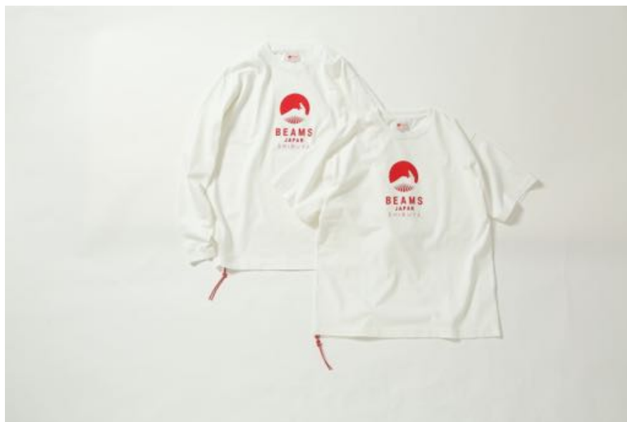
半袖Tシャツ ¥6,380（税込） / 長袖Tシャツ ¥8,580（税込）

渋谷のアイコン的なモチーフ「ハチ公」をBEAMS JAPANのロゴと組み合わせた「ビームス ジャパン 渋谷」限定のTシャツ。