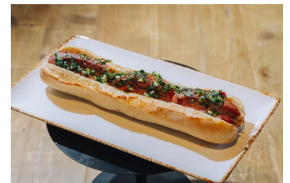
チョリパン (アルゼンチン)