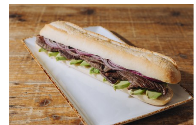
ペピート (ベネズエラ)