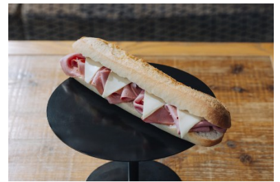
サンドイッチ・ジ・モルタデーラ (ブラジル)