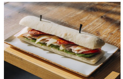
クバーノ (キューバ)