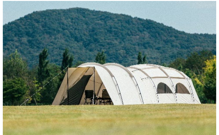
ベスティブルとオークドーム