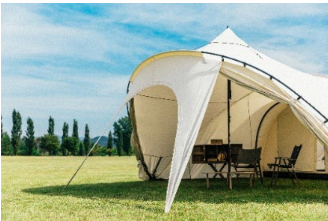
ブローシェルター