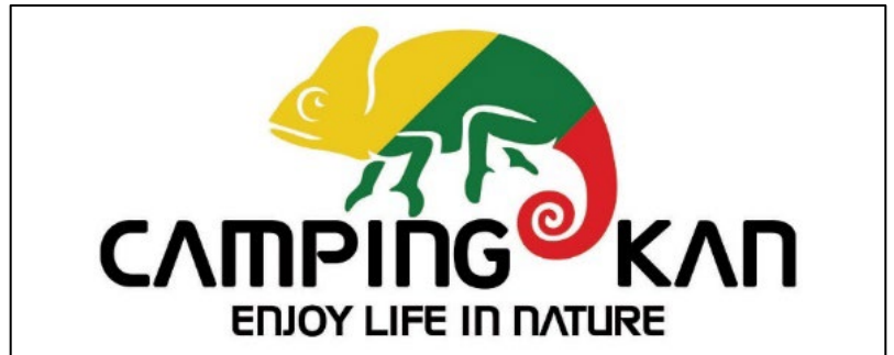
変幻自在を意とするシンボルマークのカメレオン