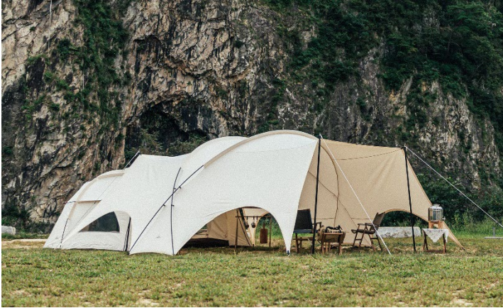
オークドームとシェルター

まるでカメレオンのように、テント同士を連結し拡張させる事で、無限大の空間を自在に作り上げる事が出来るキャンピングカンのテント。今、韓国から世界のアウトドア市場へ 向けて、さらに羽を広げていきます。