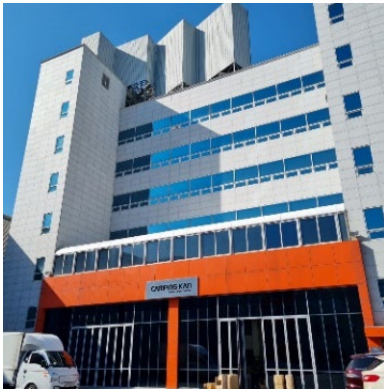
CampingKan 本社 (韓国)

「キャンピングカン」は1988年に「カン商事」として始まり、30年にわたって軍用内需と輸出を柱にコットンテントを専門的に製作している韓国の会社。軍用テントの製造として起業。2017年よりアウトドアブランド「Camping Kan」として本格的なキャンプ用テント販売を開始。韓国のアウトドア事業の人気の高まりで飛躍的な成長を遂げ、現在コミュニティサイト会員数は125,632人と韓国国内シェア No.1。カメレオンのロゴのようにトレンドによる変化を追求し、顧客のニーズに応えることを目標としている。