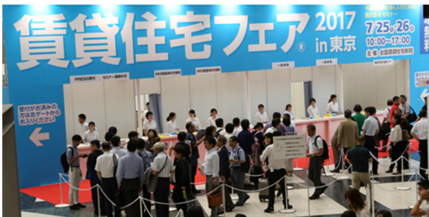
(画像:賃貸住宅フェア 2017in 東京における会場の様子)

マンションや土地を所有するオーナーや不動産仲介・管理会社向けに、セミナーと企業の展示ブースで業界の最新の情報を届けるイベントです。