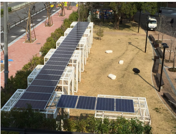
クールスポットに設置された自家消費型太陽光発電(大阪経済大学)

設置場所:大阪経済大学 大隅キャンパス (大阪府大阪市東淀川区大隅2丁目2-8)