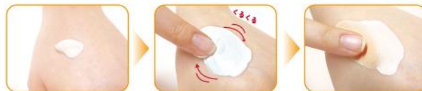
白いクリームを肌の上でマッサージするように塗ると… 肌色にカラーチェンジ！