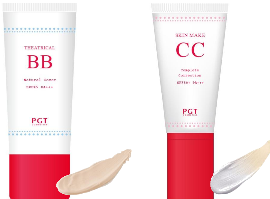
〈パルガントン シアトリカル BB クリーム〉

今回のリニューアルで「パルガントン シアトリカル BB クリーム」はよりカバー力をアップ、「パルガントン スキンメイク CC クリームN」は透明感とスキンケア効果をアップしました。さらにリーズナブルな値段になり、パッケージも一新しました。