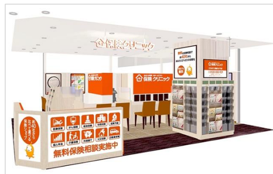
店舗外観イメージ