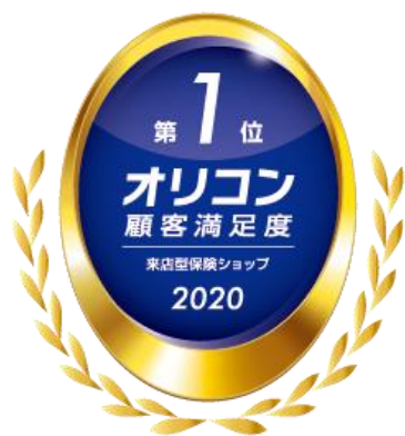
2020年 オリコン顧客満足度®調査 来店型保険ショップ 総合1位