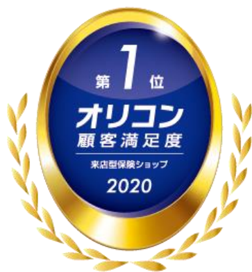
2020年 オリコン顧客満足度®調査 来店型保険ショップ 総合1位