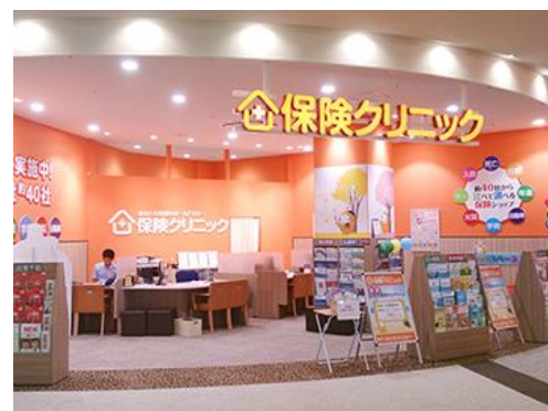
『保険クリニック』店舗外観イメージ