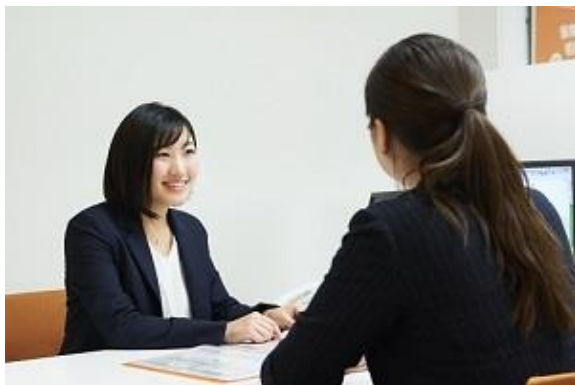
保険だけでなく、家計や資産形成など お金まわりの様々なご相談にお応えしております。

「人と保険の未来をつなぐ ～Fintech Innovation～」をきっかけ、保険販売事業、ソリューション事業、システム事業を手掛ける株式会社アイリックコーポレーション(本社:東京都文京区 代表取締役:勝本竜二、証券コード:7325、以下「当社」)は、千葉県流山市にて『保険クリニック』流山おおたかの森駅前店をオープンいたします。これにより、全国 185 店舗、関東地区で 71 店舗(千葉県で 20 店舗)となります。(2018 年 11 月 1 日時点)